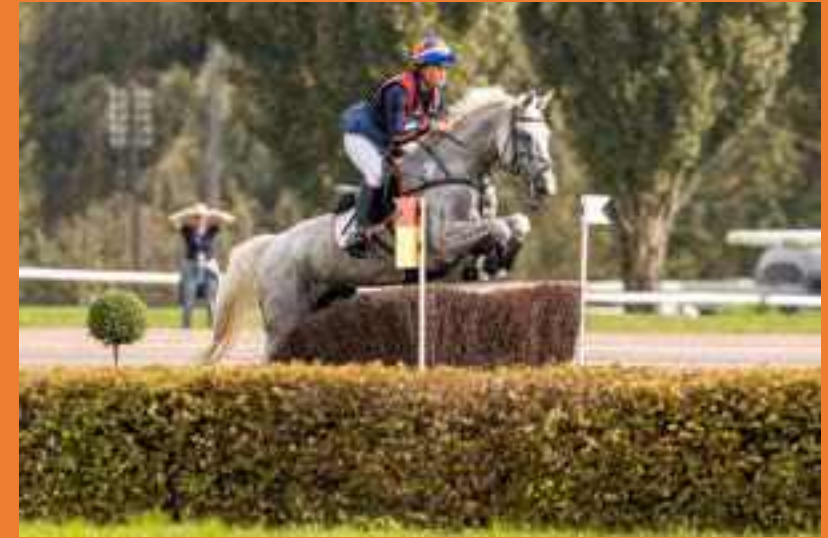
KNHS Forum Eventing