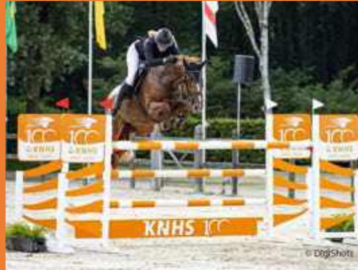
KNHS Forum Springen