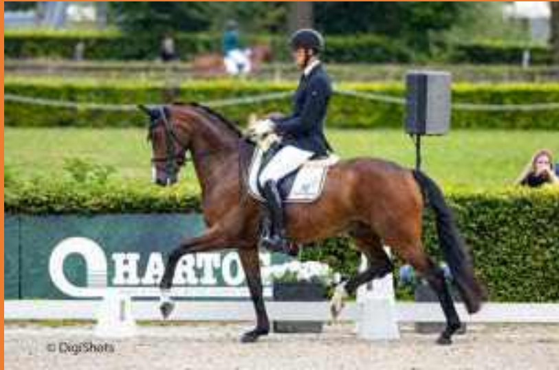
KNHS Forum Dressuur